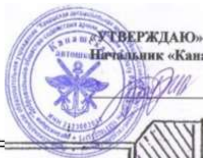
СХЕМА закрытой площадки для первоначального обучения вождению